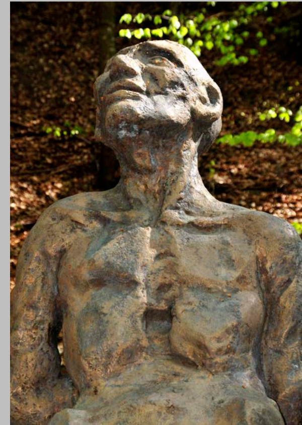
Pomnik ofiary / więźnia autorstwa Siegfrieda Haasa

Miejsca pamięci obozów koncentracyjnych Eckerwald/Schörzingen i Dautmergen-Schömberg