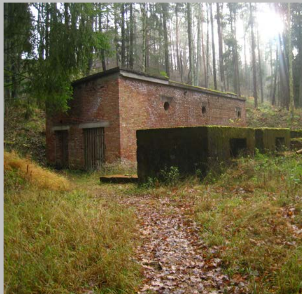
Ruiny zabudowań produkcyjnych w Eckerwald

Katastrofalne warunki w obozie, codzienna ciężka praca fizyczna i brutalny nadzór nad więźniami doprowadziły do śmierci ponad 500 z nich, przy czym nigdy nie podjęto tu regularnej produkcji.