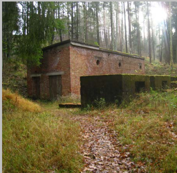
Ruine à Eckerwald

500 vies ont été anéanties de façon brutale sur ces lieux à la suite des vaines tentatives d'extraction de pétrole du schiste.