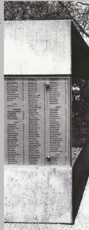
Le cube de béton avec les noms des 1774 victimes des camps de Dautmergen et Schömberg.

Le nombre réel des morts est cependant bien plus élevé puisque les malades et les mourants étaient transportés dans d'autres camps.